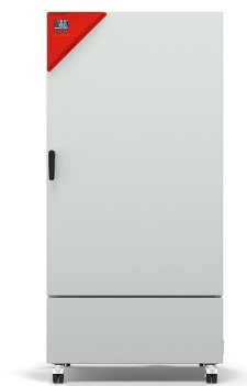
Modelo KB ECO 400