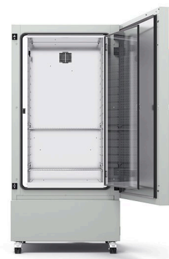
Modelo KB ECO 400