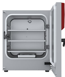
Modelo CB 170